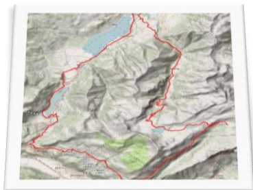
Variante Gental Trail